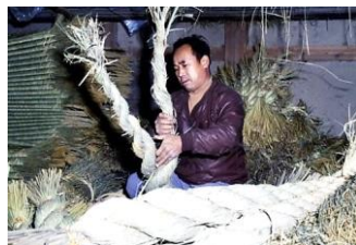
▲しめ縄づくり 鯖江市小泉町(室谷) 昭和55年12月1日 70479