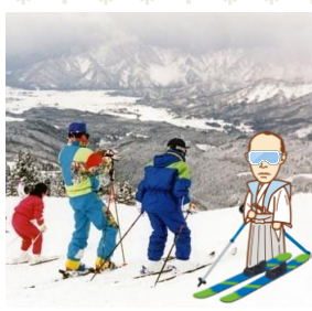
(背景) スキージャム 平成5年12月23日 78994