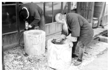
▲ウス作り(大野市内にて) 昭和40年12月22日 72045